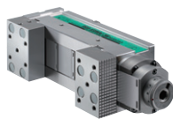
【側面取付】 【Side Mounting】